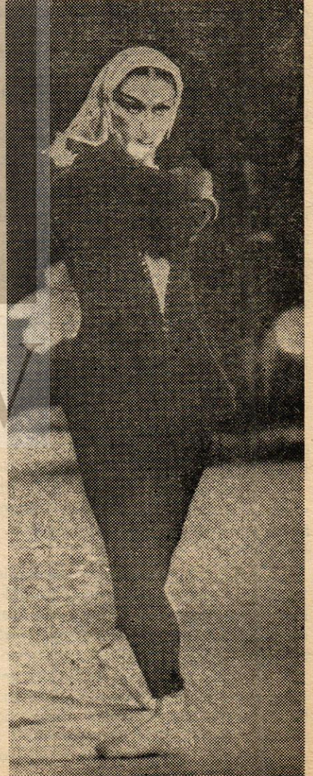
MEHMENE BANU ROLÜNDE MAYA PLISETSKAYA

Grigoroviç'in sahne düzeni ve koreografisinin düşünce ve inceliği tartışma götürmez. Bu yeni yapıta birtakım yenilikler koymasının lehine olmuş. Ferhad'ın cefasını canlandıran büyük dans sahnesi çok başarılı. Balenin anlatımı burada çok güçlü. Koreografinin bu yapıtındaki çalışması kendini eleştiren bir tutum gösteriyor. Simon Virsalazde'nin dekor ve giysileri onunla tam ahenk ve güzel bir bütün olarak hazırlanmış.